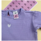
Naklejki na ubrania kolorowe 40 sztuk