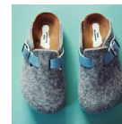
Naklejki Imienne Do Butów 20 sztuk