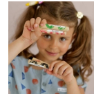
Naklejki Imienne Mini 50 sztuk