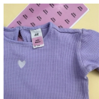
Naklejki na ubrania kolorowe 40 sztuk